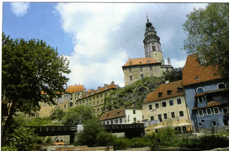
Le château gothique de Velhartice vient d'être restauré. De nombreuses animations culturelles y sont proposées durant tout l'été.

mération, 90 km/h sur route et 110 ou 130 km/h sur autoroute. L'achat d'une vignette autoroutière est obligatoire depuis 1995. Elle est incluse dans le prix des locations de voiture. Attention, les vols de voitures sont en augmentation.