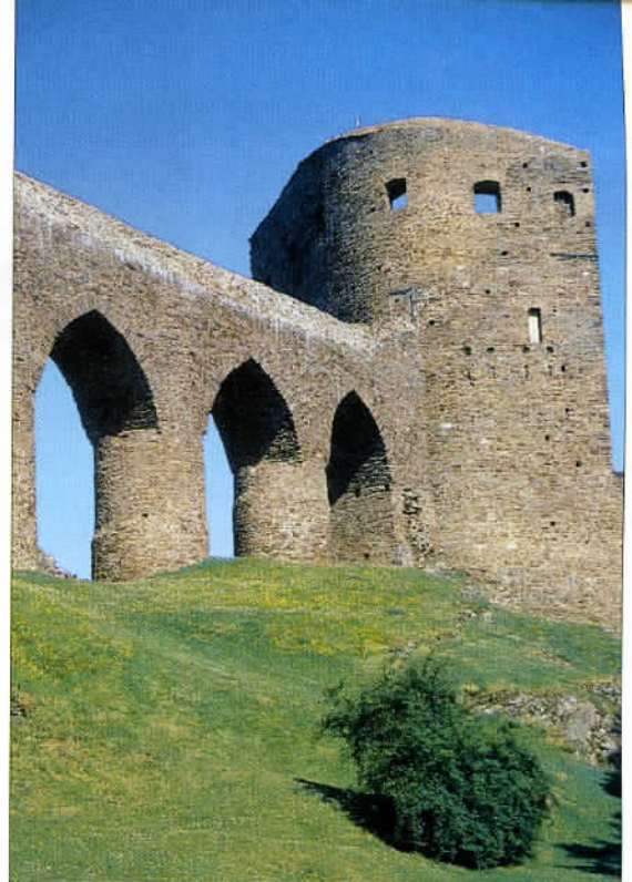
Vue du château de Cesky Krumlov, joyau de la Renaissance, classé par l'Unesco en 1992, dominant le quartier du Latran au bord de la Vltava.

Une étape située au cœur du site, sorte de Vosges tchèques près des frontières allemande et autrichienne. De nombreuses pistes ouvertes aux véhicules motorisés permettent de faire de belles balades tout-chemin au sein d'une nature préservée. En hiver, le ski prend le relais à la station de Zelezná Ruda. Entre la Sumava et Cesky Krumlov - 120 kilomètres par la route 39 - le lac artificiel de Pilno permet de se rafraîchir grâce aux activités aquatiques. Sorte de « Riviera tchèque ». Quant à Cesky Krumlov, inscrite au patrimoine mondial de l'Unesco en 1992, elle constitue, indéniablement, notre coup de cœur en République tchèque : pas moins de 250 monuments et édifices classés. Cette fabuleuse petite cité médiévale offre une délicieuse atmosphère. Le soir, l'éclairage du château lui confère une inoubliable touche de magie ! A noter aussi, le musée Egon Schiele, maître de l'expressionnisme natif de la région. Enfin, la dégustation des spé-