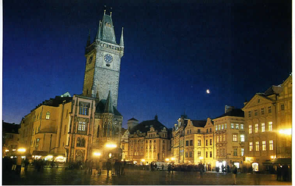
Incontournable place de la Vieille-Ville à Prague : avec son hôtel de Ville et son horloge astronomique.