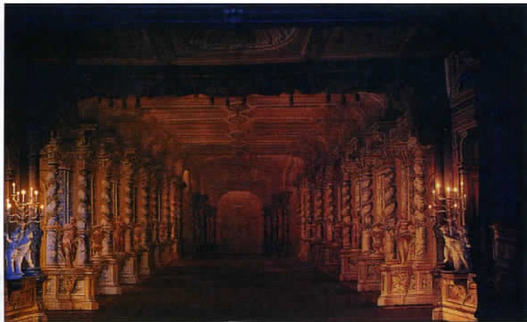
Le théâtre du château de Cesky Krumlov, (1680) est l'un des plus anciens d'Europe. Les décors, les costumes et la machinerie sont d'origine.