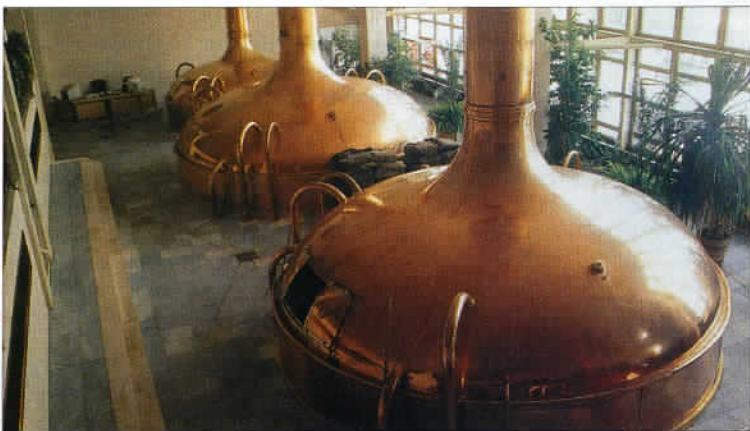
Parmi les meilleures bières de Bohême, citons la Pilsner Urquell et la Budweiser Budvar. Ici, une salle de brassage.

idéal de Prague, la capitale aux cent clochers !