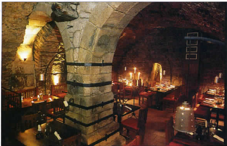
Depuis le Moyen-Age, dans les sous-sols de Pilsen quelque vingt kilomètres de caves ont été aménagés sur deux, voire trois niveaux.