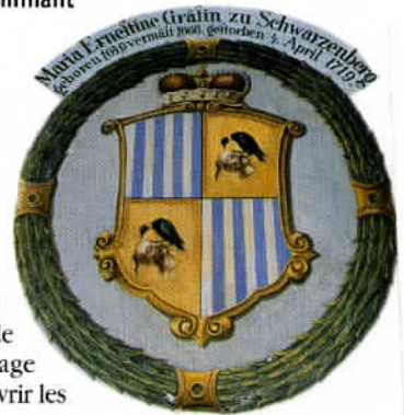
Le pays compte près de 180 palais et châteaux à visiter. Les nombreuses armoiries sont les témoins de cette richesse culturelle.

Puis direction le château de Romžberk à 24 kilomètres au sud par la 160. L'imposant édifice perché sur un promontoire mérite le détour. Ensuite, c'est Hlásovice, ravissant village en cours de restauration et Trebon, capitale de la pêche à la carpe. Puis Jindřichuv Hradec ainsi que Česká Budejovice dont l'intérêt réside dans la visite de sa brasserie Budvar. Devenue Budweiser aux Etats-Unis - une appellation usurpée par les Américains. Pour information, le demi-litre de bière coûte en moyenne de 20 à 25 couronnes. (moins d'un euro). Quelques caves sont à visiter pour prendre un verre, mais les gens d'ici ne brillent pas par leur hospitalité. Enfin, par la E55, Tabor est notre ultime étape, une autre ville médiévale - à 80 kilomètres au sud de Prague - fondée par les partisans du réformateur Jan Hus. Une vue globale sur la ville, le vieux Tabor et ses maisons historiques, sa place principale et son musée de la révolution hussite attendent le visiteur. Chemin faisant, de retour vers Prague, les visites des châteaux de Konopiste et Cesky Sternberk sont une formidable conclusion à ce voyage au cœur de l'Europe romantique. ■