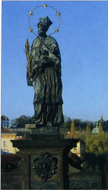
Les statues du Pont Charles symbolisent les grandes figures de l'Église. Parmi celles-ci : Saint-Jean-Népomucène, reconnaissable aux cinq étoiles encadrant son visage.